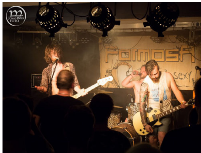
Sommerfest der Fachschaften ETEC und GeistSoz.

Am Tag selbst sollte das Wetter doch besser als erwartet werden. Die meisten Studis hat aber das schlechte Wetter am Nachmittag und die Wettervorhersage abgeschreckt. Die motivierten Helfer natürlich nicht! Mit gut besetzten Ständen und ein paar Startschwierigkeiten wurden dann die Grills angeschmissen und das erste Bier verkauft. Der Aufbau wurde so umstrukturiert, dass draußen eine Dj-Pult und daneben eine Sitzecke ueberdacht gebaut wurde. Die zwei Bands wurden ins AKK verlegt, sodass sie wetterunabhängig auftreten konnten. Und die Stimmung stieg als Mess Up Your DNA anfang zu spielen und Formosa das dann noch übertoppte. Mit einem gut gefülltem AKK-Cafe und einer regen Menge an Gästen an den Ständen und unter den Zelten lief es doch besser als erwartet. Die grossen Mengen, die von den draußen spielenden Bands angezogen würden, blieben jedoch aus. Und so ging nach langen Aufräumtagen danach und viel Hilfe von erfahrenen Festorganisatoren das Fest zu Ende. Trotz allem ließen sich die negativen Zahlen nicht verhindern und so sind wir sehr dankbar für die Ausfallbürgschaft des Fördervereins, die wir gehofft hatten nicht zu benötigen.