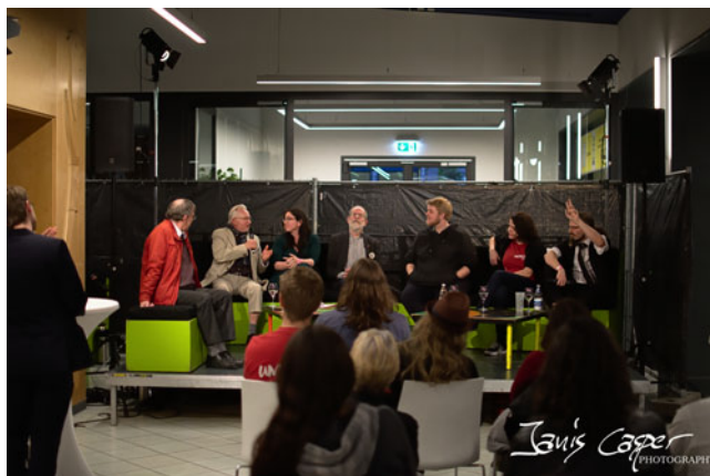
Podiumsdiskussion während der Eröffnungsgala „Das Erbe der 1968er.“