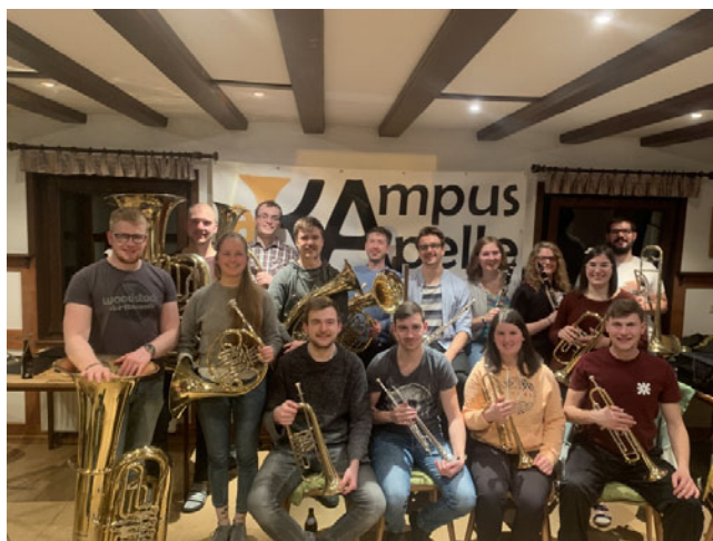
Gruppenfoto vom Probewochenende.

Freitagabend starteten wir mit einer ersten Probe ins Wochenende. Hauptsächlich standen neue Stücke für den bevorstehenden Auftritt beim Karlsruher Faschingsumzug auf dem Programm. Mit einem Spieleabend ließen wir den ersten Abend ausklingen.