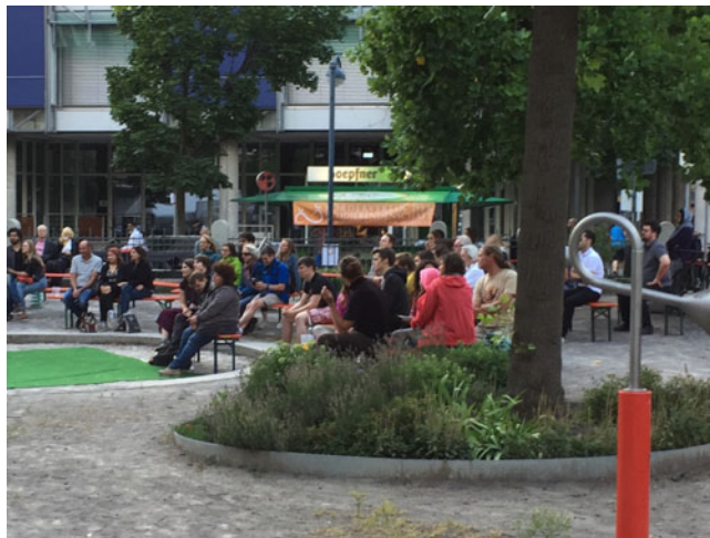
Bierstand bei ECKKULTURdörfle.

Wir hatten die Möglichkeit, beim ECKKULTURdörfle-Fest im Juni 2018 einen Bierstand zu übernehmen und dabei auf den Förderverein aufmerksam zu machen.