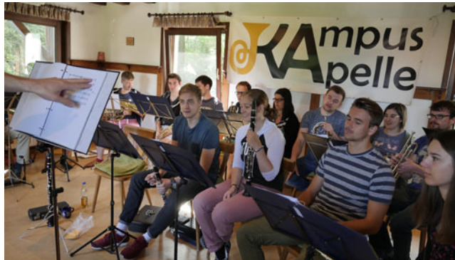
Probe beim Hüttenwochenende.