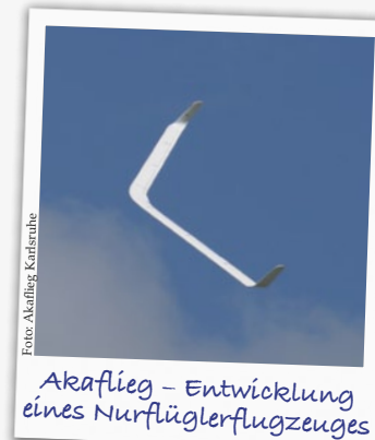
Akaflieg - Entwicklung eines Nurflüglersflugzeuges