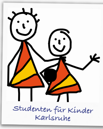
Studenten für Kinder Karlsruhe